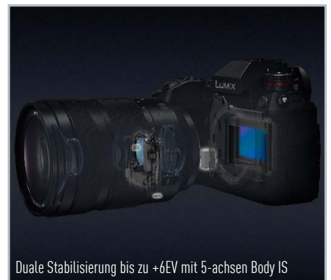
Duale Stabilisierung bis zu +6EV mit 5-achsen Body IS