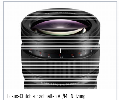
Fokus-Clutch zur schnellen AF/MF Nutzung